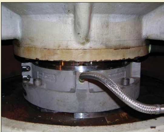
La instalación y la reparación de los sellos bipartidos se completan sin necesidad de desarmar el equipo, ahorrando tiempo y costos de operación.