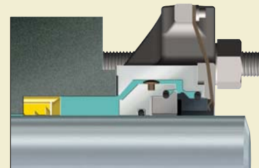
Sello bipartido 442 con SpiralTrac™

El sello 14K de Chesterton tiene la capacidad única de aislar el ambiente de la caja prensaestopas de aplicaciones difíciles con lodos. El sello 14K previene el ingreso de los lodos que tratan de retornar a la caja prensaestopas, en forma intermitente, debido a fluctuaciones en el proceso.