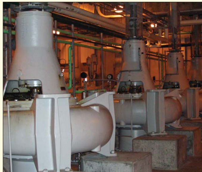
Bombas de efluentes, en servicio por más de 12 años, selladas con sellos bipartidos de 200 mm (8.00 pulgadas).

Los especialistas de Chesterton trabajan muy de cerca con los operadores del proceso para entender mejor las causas por las que falla el sistema. Al entender la dinámica del sistema, los especialistas pueden combinar el diseño bipartido de los sellos con el conocimiento de operaciones para desarrollar soluciones de sellado más confiables y económicas para su equipo rotativo grande.