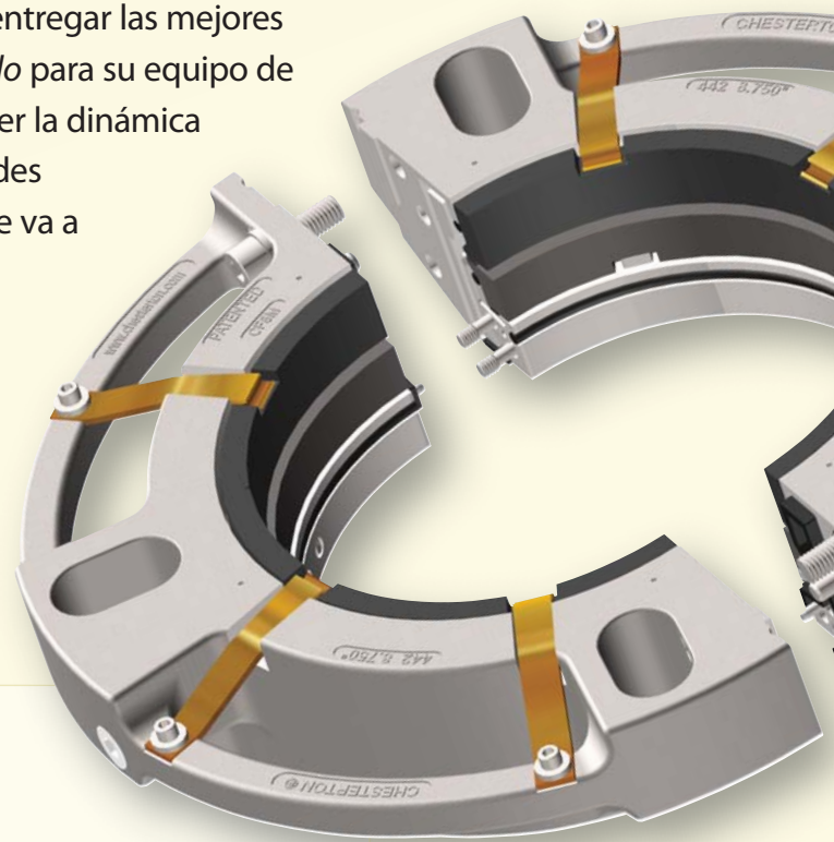
Sello bipartido 442

Nuestros especialistas entrenados al igual que nuestros ingenieros y equipo de servicio van a escucharlo para poderle entregar las mejores soluciones totales de sellado para su equipo de proceso crítico. Al entender la dinámica de su proceso y necesidades individuales, Chesterton le va a ayudar a desarrollar soluciones de sellado de largo plazo que lleven a cumplir con estos requerimientos.